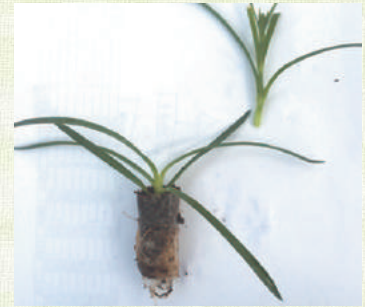
3対(6枚)の葉を残してピンチして定植