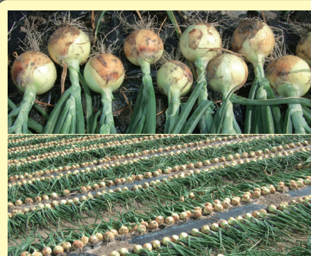
タマネギ 愛知・宮城・佐賀

ベストマッチ区はじっくりと肥料が効き、樹勢が一定になり、実の揃い、成りが良く、追肥の手間・コストもかからず、他の管理に手をかけることができました。根も旺盛に張っていました。