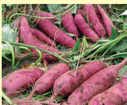
サツマイモ 茨城・千葉・鹿児島

苗栽培は肥料焼けや肥料ムラが出てしまい、悩みの種でしたが、ベストマッチを使うと健苗が採れ、植え直しの手間もかからず助かっています。本圃用も形が揃い、良品が収穫できました。