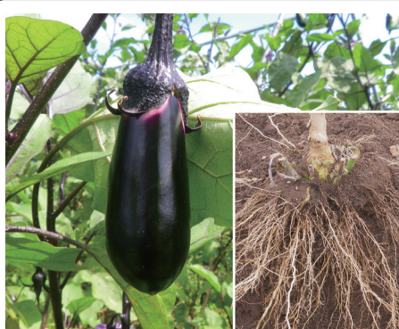
ナス 群馬・茨城・栃木

追肥いらずで手間いらず。一回の施肥で穏やかに効き続けてくれました。肥料の効き方がイチゴに良く合っていて、これまでよりも甘みが増し、食味・収量も安定しました。