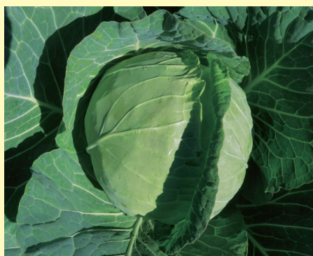
キャベツ 愛知・神奈川・群馬

大雨が来ると慣行の施肥では肥料が効きすぎ、形が崩れてしまうのが悩みでしたが、ベストマッチでは安定した球を収穫できました。