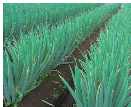
ネギ 埼玉・福島・宮城

揃い良くじっくりと効いてくれるおかげで、収穫期に起こりやすい球割れも少なく、肥切れによる縁腐されの心配もなく良い球が育ちました。圃場持ちも良くなりました。