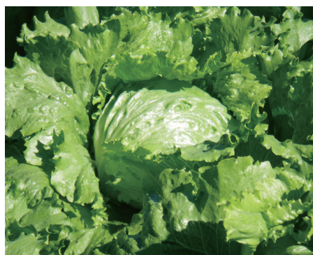
レタス 長崎・群馬・長野

大雨が来ると慣行の施肥では肥料が効きすぎ、形が崩れてしまうのが悩みでしたが、ベストマッチでは安定した球を収穫できました。