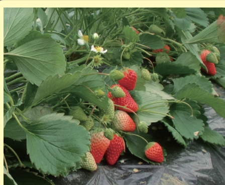
イチゴ 栃木・群馬・静岡

追肥の手間が省けるだけでなく、肥料が効きすぎず、ネギに必要な時期にじっくりと効いてくれるため、揃いと太りの良いネギを収穫することができました。